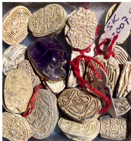
Abb. 5 Ein Blick in die Schachteln, die die 700 Skarabäen beherbergen.

Die Sammlung Keel ist «eine Sammlung [...], deren Qualität weltweit ihresgleichen sucht», urteilt Prof. em. Christoph Uehlinger. Sie öffnet ein Fenster in die Kultur Kanaans. Diese steht zu Unrecht im Schatten Ägyptens, Mesopotamiens oder Griechenlands, waren es doch gerade die Kanaanäer, die erfolgreich zwischen den nördlichen und südlichen, den östlichen und westlichen Kulturen gehandelt und Ideen vermittelt haben. Sie entwickelten das Alphabet, das seinen Siegeszug über die ganze Welt antrat und sie kultivierten mit dem Vertrag eine friedliche Alternative zur kriegerischen Konfliktlösung.