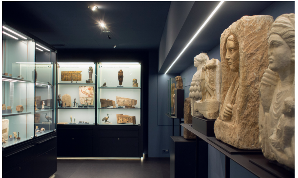
Fig. 3 Le deuxième musée à son emplacement actuel dans l'aile 2 de l'université Miséricorde.

Damit das nun schon heftig strampelnde Kind in trockenen Tüchern empfangen werden konnte, mussten die entsprechenden Strukturen geschaffen werden. 2004 wurde der Verein «Projekt BIBLE+ORIENT» gegründet, der das Museum unterstützen und das Interesse dafür in der breiten Öffentlichkeit fördern sollte. Im Jahr darauf gründete dieser Verein zusammen mit dem Kanton Freiburg und der Universität Freiburg die Stiftung BIBLE+ORIENT zum Zweck der Aufwertung und Entwicklung der Sammlungen BIBLE+ORIENT der Universität Freiburg und dem Ziel der Schaffung eines Museums.