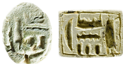
Abb. 1 Ein Skarabäus und eine rechteckige Platte aus der Sammlung Keel mit dem Bekenntnis: «Amun-Re ist mein Herr!»

OK: Dans le contexte que tu as évoqué, un message tel que celui que l'on trouve sur les bases de nombreuses sceaux-amulettes sigillaires de la XVIII e dynastie (env. 1500-1300 av. J.-C.) m'a semblé utile. Il dit: Amon «le caché» (qui se révèle dans) Re «le soleil» (est) «mon seigneur». L'idée que le soleil, en tant que manifestation d'une grandeur plus vaste et cachée, est ma raison de vivre et celle d'innombrables autres créatures, est souvent évoquée dans les hymnes solaires égyptiens du Nouvel Empire (environ 1500-1000 av. J.-C.). C'est d'elle que semble être influencé l'insolite Psaume 104. Le psaume 104 était l'une des sources du «Cantique du soleil» de François d'Assise. Une caractéristique particulière de ce chant est la fraternité fortement soulignée entre les créatures. Elle joue un rôle important dans le discours actuel sur les relations entre les êtres vivants.