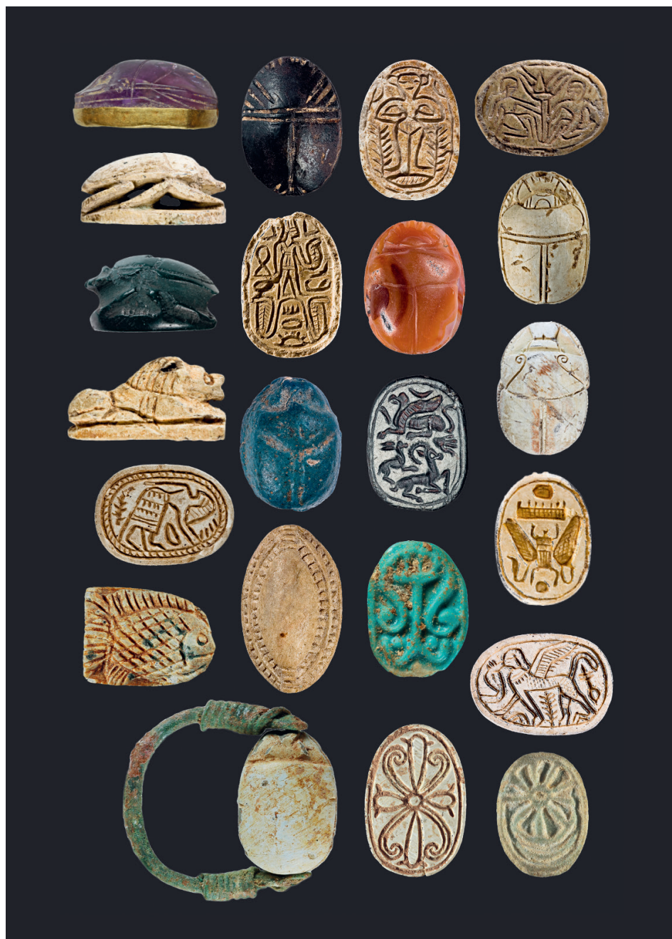
Abb. 6 Die Schönheit der Skarabäen gehört zu ihrem Zauber. Collage: Thomas Staubli

Ein Vivarium mit lebenden Skarabäen ermöglicht es den Besuchenden, die Tiere zu beobachten. Mit etwas Glück wird man also selber sehen können, wie die Tiere aus Tierdung kreisrunde Futterportionen ausschneiden und ihr Nest rollen. Diese auffällige Verhaltensweise hat ihnen zum Übernamen «Pillendreher» verholfen. Und hierin liegt der Schlüssel, warum Skarabäen zu Symbolen der Neugeburt, des Aufstehens und des Werdens wurden.