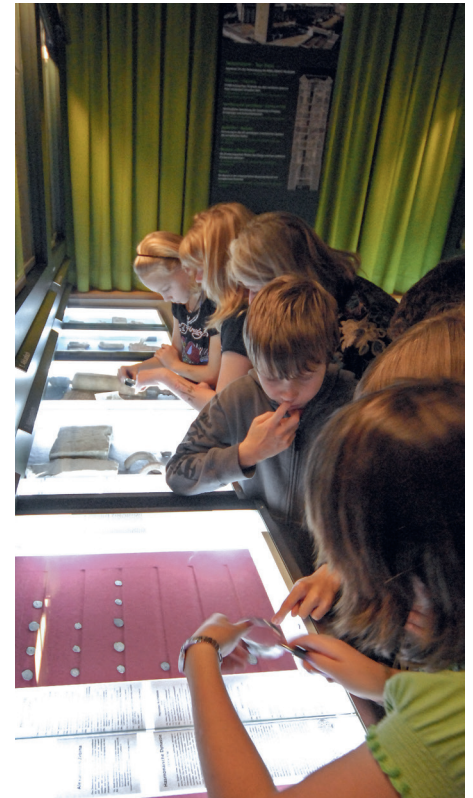
Fig. 2 Le premier musée dans l'ancien bureau du professeur Othmar Keel dans l'aile 4 de l'université Miséricorde. Visite d'une classe de religion. En arrière-plan, sur le mur, la vision du musée dans la Tour Henri.

à la manière des musées d'art et d'histoire traditionnels, mais dans le contexte de ce qui est devenu «l'œcuménisme vertical» au Département d'études bibliques. L'objectif était de montrer comment des motifs importants de l'Orient ancien ont été conservés malgré tous les bouleversements culturels et religieux, grâce à des transformations et des